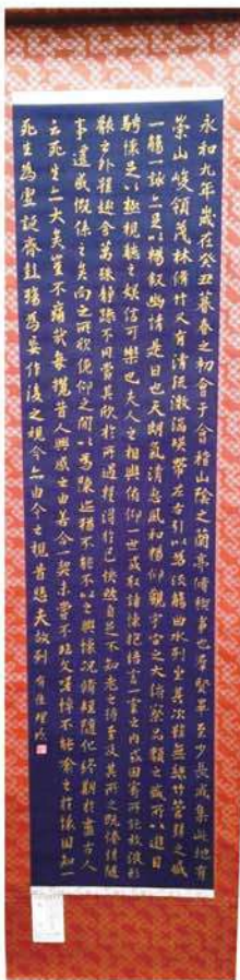
田平 有佳理 ⇒