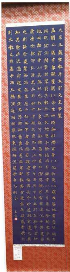
葛木 董 ⇒