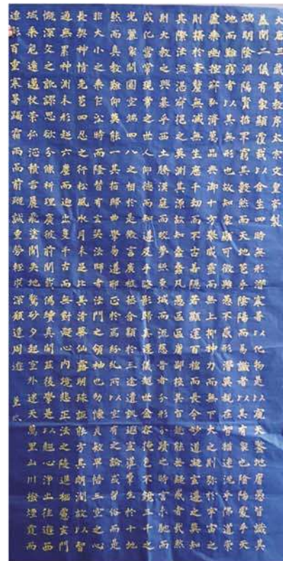
11月の「書の甲子園」に出品します。