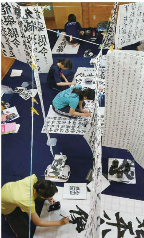
真夜中もず〜っと書いてます。