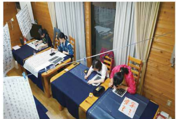
合宿 細字の作品は1枚仕上げるのに6時間!! 抜群の集中力です。530文字に命を!