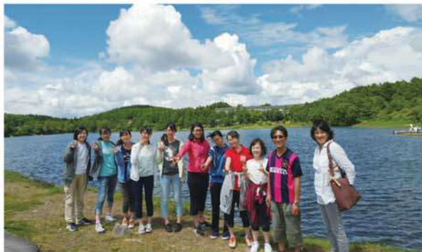
8月蓼科 合宿(女神湖畔にて)