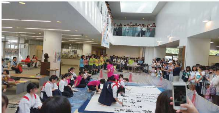
コーラス部とのコラボレーション ♪♪