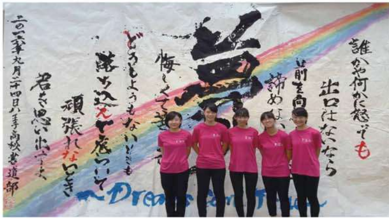
1年生 揃いのTシャツで気持ちを一つに！