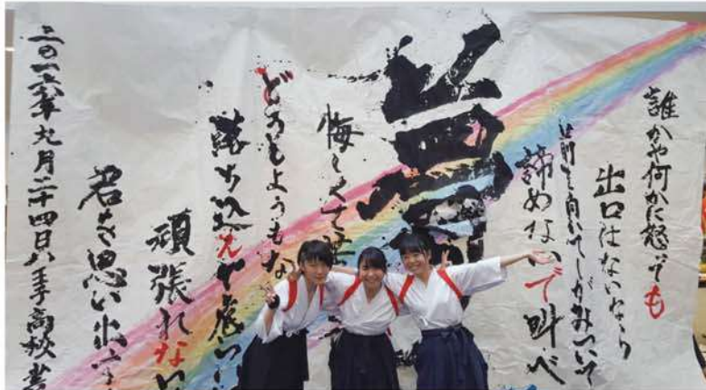
3年生 達成感の涙は、輝いてました。(*_*)